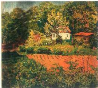
Яблони цвет. 1980 г. Бумага, акварель, белила.