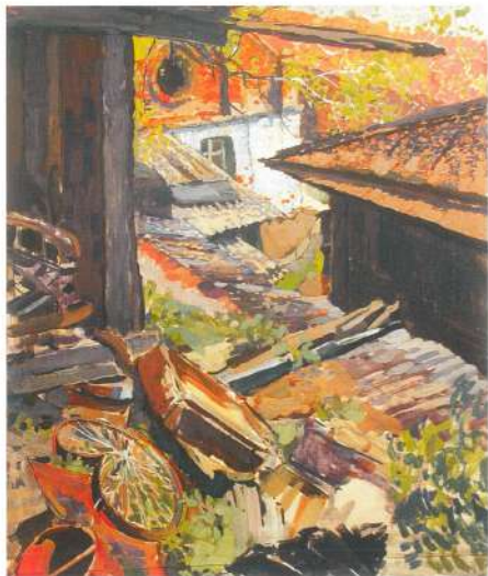
У старого сарая. Из цикла "Почтовый переулок" 1989 г. Картон, гуашь, темпера.