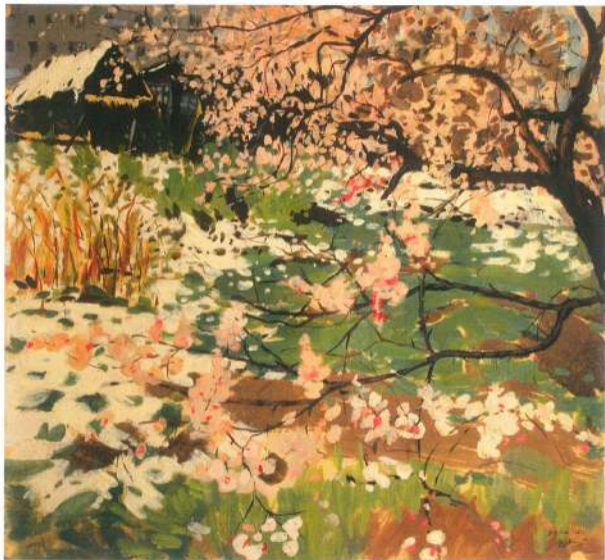
Нечаянный снег. 1985 г. Картон, темпера.