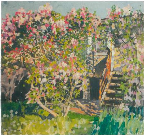
Сиреневый май. 1998 г. Картон, гуашь, темпера.