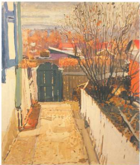
Зеленая калитка. 1983 г. Картон, гуашь, темпера.