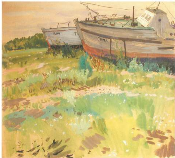
Последний причал . 1982 г. Картон, гуашь.