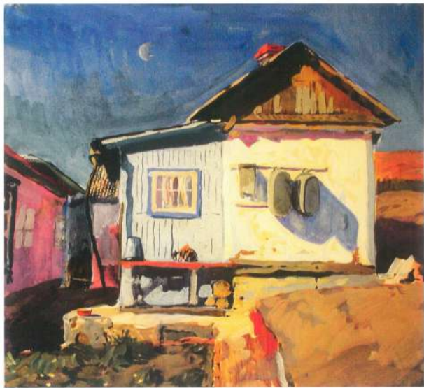
Летняя кухня. 1982 г. Картон, гуашь, темпера.