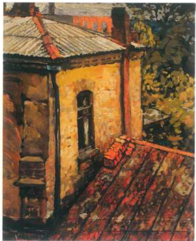
Слышен звук виолончели. Из цикла "Почтовый переулок". 1990 г. Картон, гуашь, темпера, пастель.