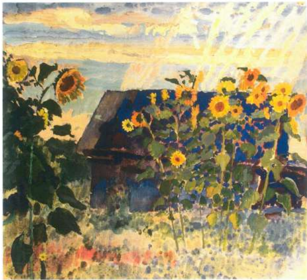
Дождь прошел. 1996 г. Картон, гуашь, темпера.