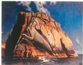
Сторож. 1990 г. Картон, темпера.