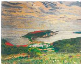
Уссурийский залив. 1989 г. Картон, темпера.