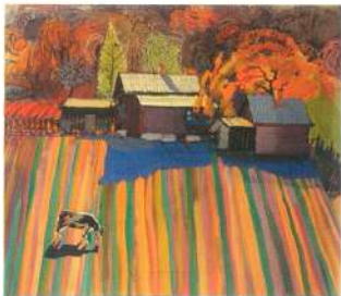
Пейзаж с коровой. 1987 г. Картон, гуашь, темпера.