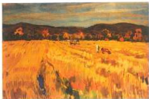
Синяя лужа. 1983 г. Картон, темпера.