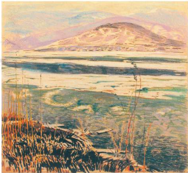
Первая пороша. 1980 г. Картон, пастель.