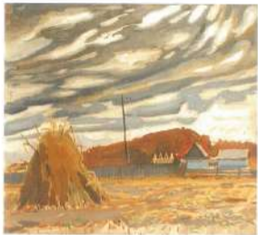
В предчувствии снега. 1983 г. Картон, гуашь, темпера.