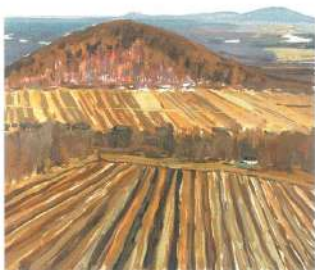
Виноградники осенью. 1983 г. Картон, темпера.