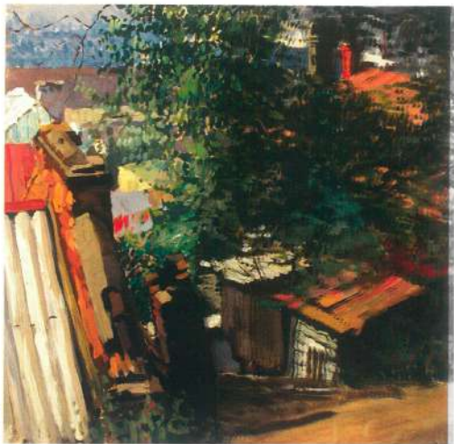
Старые трубы. Из цикла "Почтовый переулок". 1989 г. Картон, гуашь, темпера.