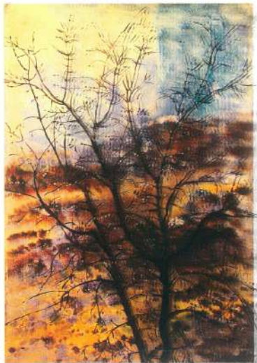
Капли осени. 1980 г. Картон, гуашь.