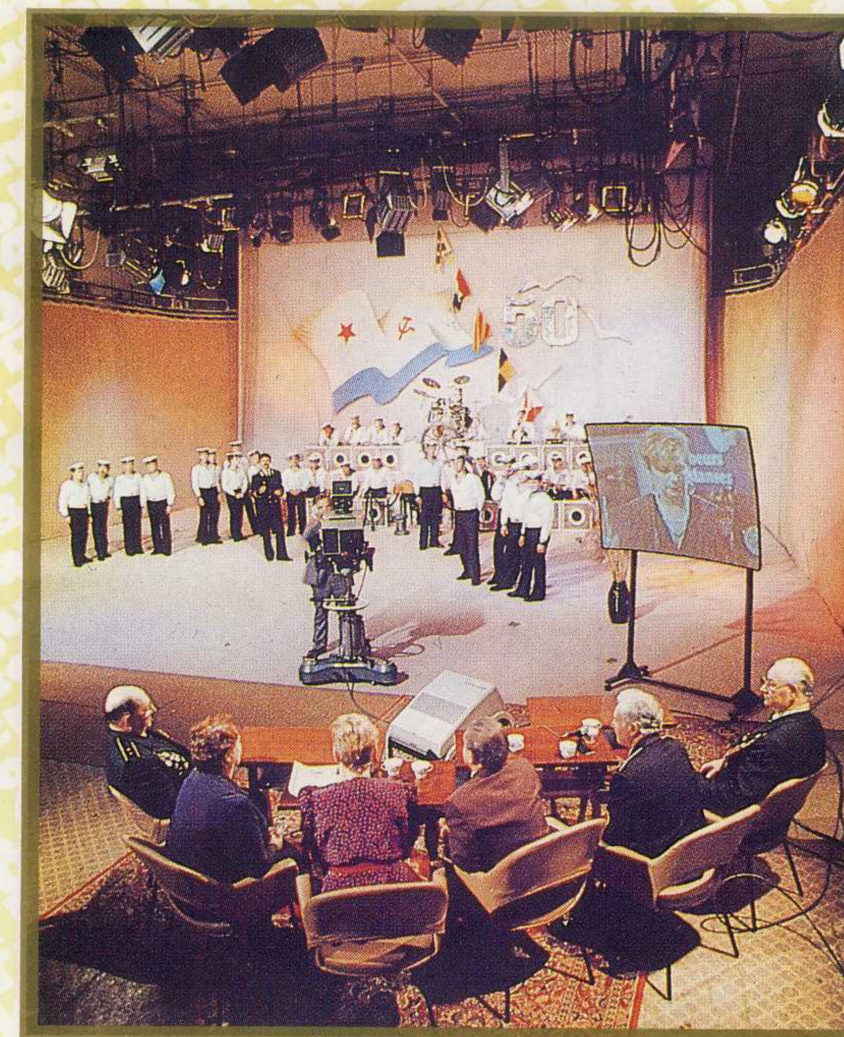
Ансамбль песни и пляски Тихоокеанского флота с новой программой.

Съемки... монтаж... эфир... Телевахта продолжается.